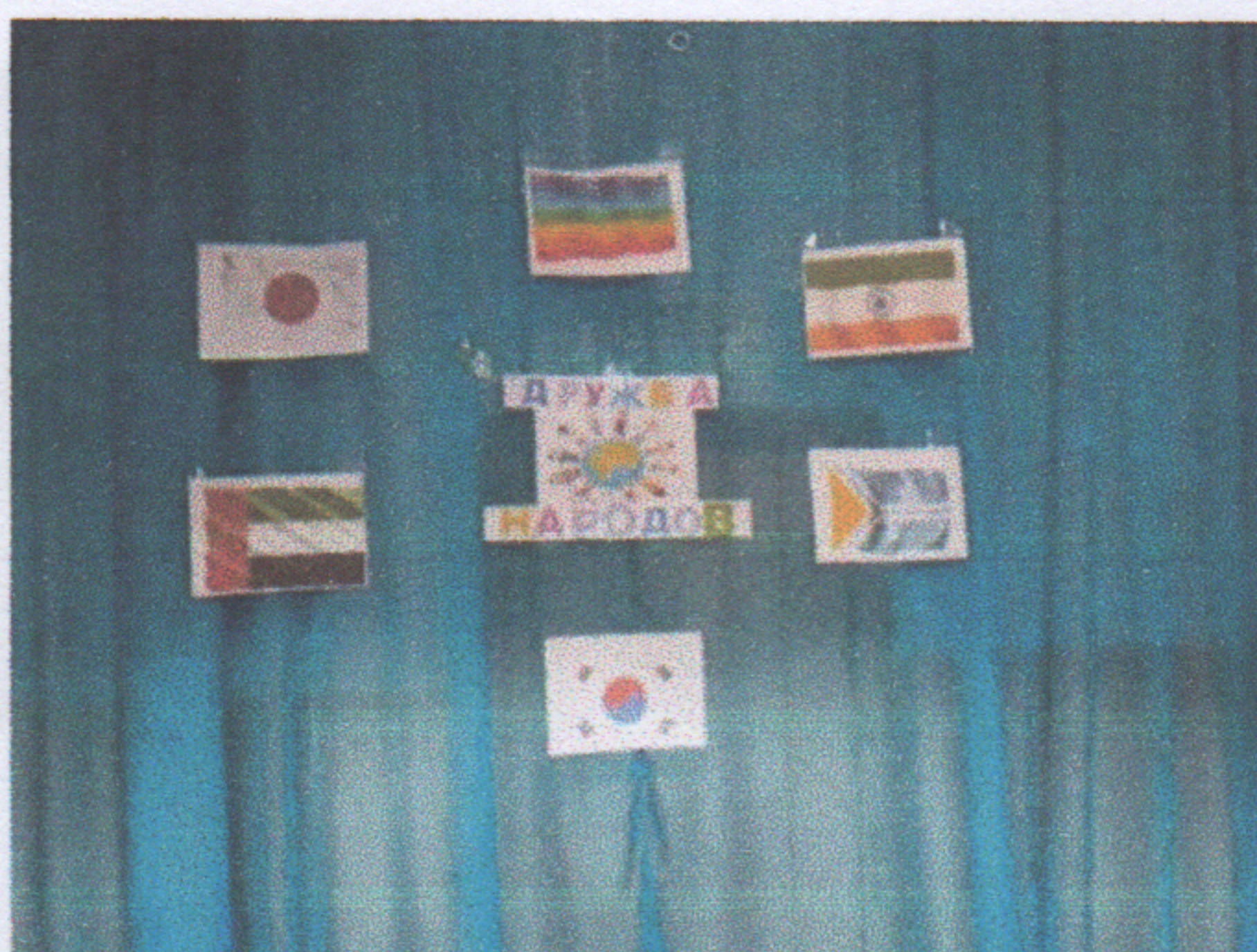
Работа с педагогами