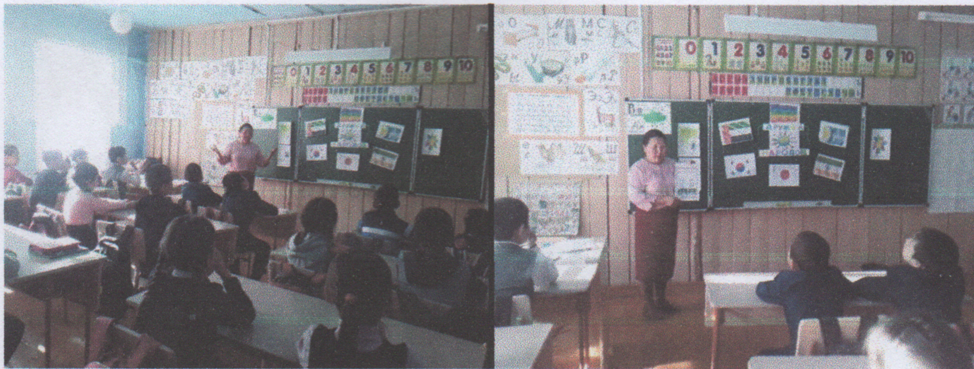
Викторина: «Толерантность –это дружба!»